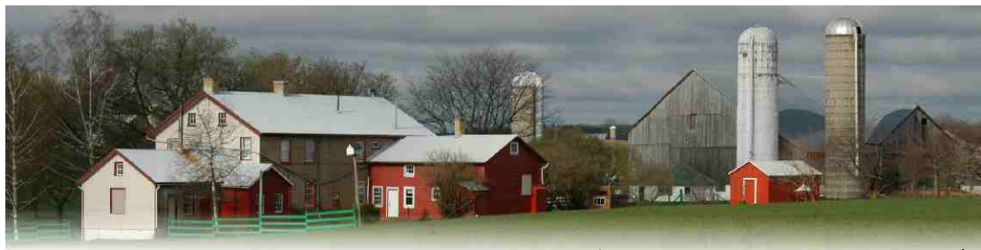
カナダ、オンタリオ州、セントジェーコブス